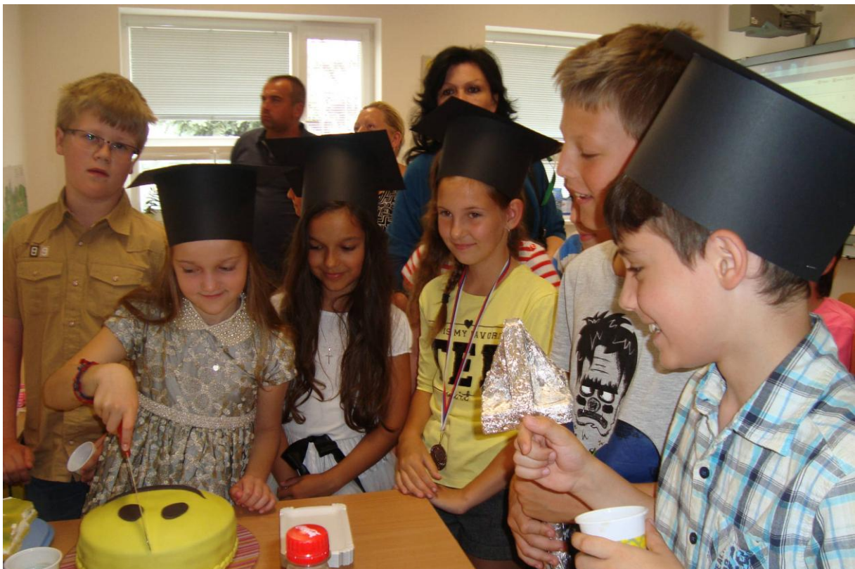
To sme my...:-) A naša torta